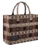
SFASA01183 H23KASBAH SMILEY 365€ / 245€ £409 / £274