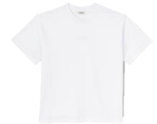
SHPTS01243 E23BOUTIQUE TEE 115€ / 78€ €129 / £86