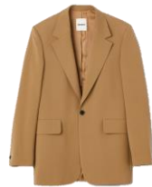
SHPVE00683 H23MODE CAMEL 585€ / 392€ €579 / €387