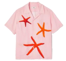
SHPCM00908 H23STARFISH PINK 195€ / 131€ €249 / £146