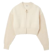
SFPCA00829 H23BAREY 275€ / 185€ £309 / £207