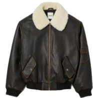
SFPBL00830 H23MITCHELL 695€ / 466€ €779 / €521