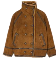
SFPOU00575 H23ELYA 1595€ / 1069€ €1769 / £1185