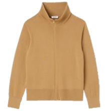
SHPTR00362 E22TRUCKER CARDIGAN 295€ / 198€ €329 / £220