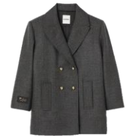
SFPOU00573 H23MARLLY 495€ / 332€ £559 / £374