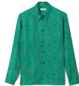
SFPCM00951 H23AFRANIE 265€ / 178€ £299 / £200