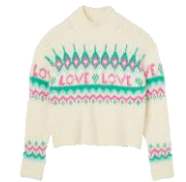
SFPPU02110 H23LOVER 265€ / 178€ £299 / £200