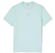
SHPTS00990 H21SANDRO TEE MENTHE 95€ / 64€ €99 / €66