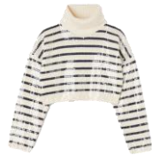
SFPPU02085 H23ARIEL 265€ / 178€ €299 / €200