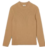
SHPTR00392 H23RIBSTITCH 245€ / 165€ €279 / £186