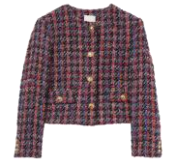
SFPVE00873 H23LOLA 375€ / 252€ €419 / £280