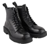
SHACH00613 H23RANGER BOOT 475€ / 319€ €469 / €314