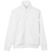
SHPSW00597 H23TRACK JACKET 245€ / 165€ €279 / £186