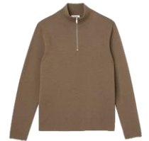
SHPTR00161 H20ZIP SWEATER KAKI 255€ / 171€ €289 / £193