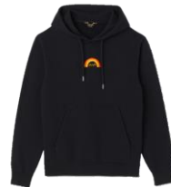
SHPSW00590 H23WRANGLER HOODIE 175€ / 118€ €199 / £133