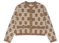
SFPCA00904 H23MONO 295€ / 198€ £329 / £220