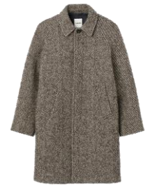
SHPMA00307 H23MAC WOOL TWILL 695€ / 466€ €779 / €521