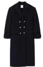
SFPOU00584 H23BETINA 575€ / 386€ €639 / £428