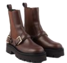
SFACH01022 H23HELEN 385€ / 258€ £429 / £287