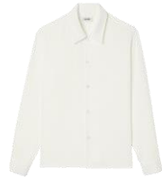
SHPCM00937 H23REQUIN 195€ / 131€ €249 / £146