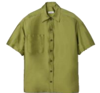
SFPCM00974 H23CACAO 245€ / 165€ £279 / £186