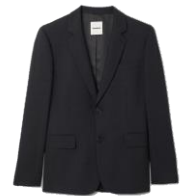
SHPVE00821 H23LEGACY GRIS FONCÉ 475€ / 319€ €469 / €314