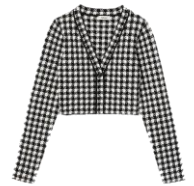
SFPCA00872 H23MEEL 195€ / 131€ €219 / €146