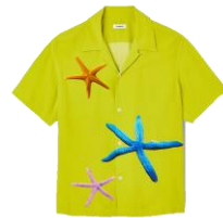
SHPCM00917 H23STARFIH LIME 195€ / 131€ €249 / £146