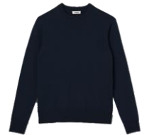
SHPTR00117 H19CREW MERINOS 225€ / 151€ €249 / £166