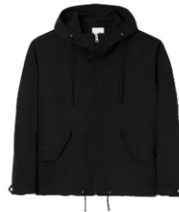
SHPBL00850 H23WINDY 345€ / 232€ €389 / £260