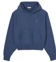
SHPSW00565 H23VERTICAL HOODIE 175€ / 118€ €199 / €133