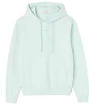
SHPSW00458 H21SANDRO HOODIE 185€ / 124€ €209 / €140