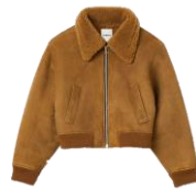
SFPOU00523 H23CASSY 1395€ / 935€ £1549 / £1037