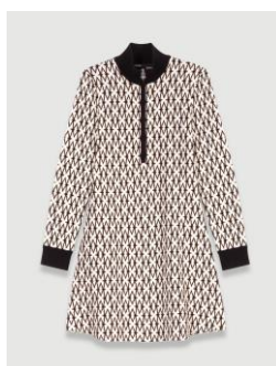
Dress ROYAL 255€ / 165€