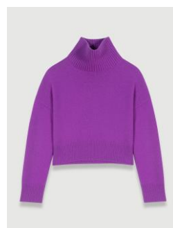
Sweater MEIGE 355€ / 230€