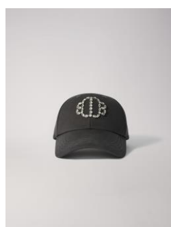
Cap ECAPSTRASS 95€ / 61€