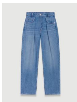
Jean PIA 195€ / 126€