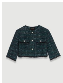
Jacket VIZELDO 275€ / 178€