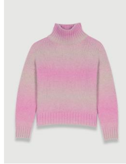
Sweater MEGEVY 295€ / 191€