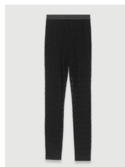
Legging PAISERANE 155€ / 100€