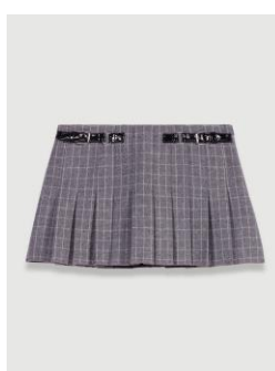
Skirt JOCELYN 215€ / 139€