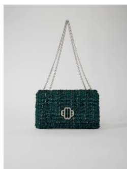
Bag CLOVERBLOOMTWEED 335€ / 217€