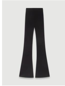
Trousers PARISO 175€ / 113€