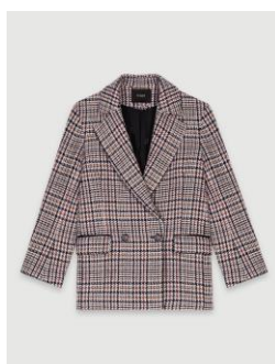
Jacket VAPINETTE 415€ / 269€