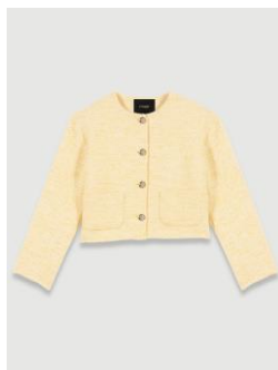
Jacket VIVETA 335€ / 217€