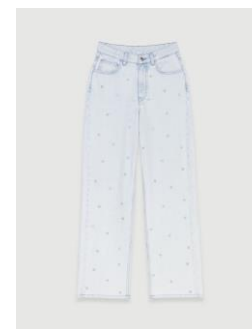
Jean PESTRELLA 215€ / 139€