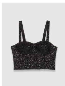
Top LARGOT 155€ / 100€