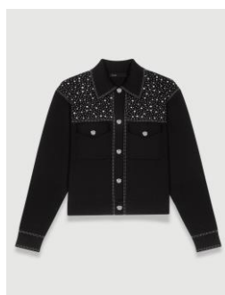
Cardigan MYVESTY 295€ / 191€