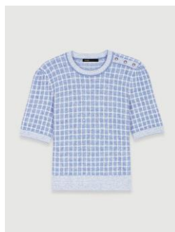
Sweater MALONYTA 195€ / 126€