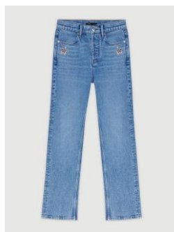
Jean PAGODY 215€ / 139€