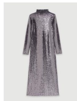
Dress RIPAJI 375€ / 243€