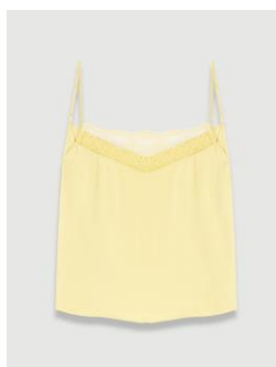
Top LIX 115€ / 74€