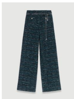
Trousers PIZELDA 255€ / 165€