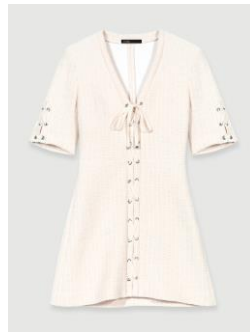
Dress RILENA 335€ / 217€