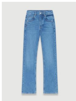
Jean PENELOPE 195€ / 126€