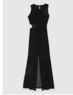
Dress RAISERANE 355€ / 230€