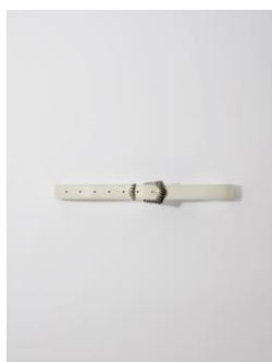
Belt AGRUNGE 135€ / 87€