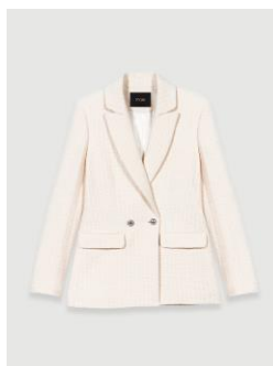
Jacket VILENO 395€ / 256€