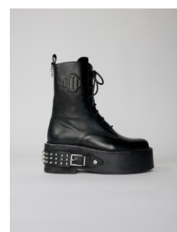
Shoes FANGER 435€ / 282€