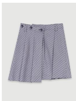
Skirt JEEDOMA 235€ / 152€