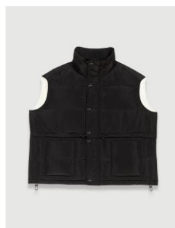
Down jacket GOUZI 355€ / 230€