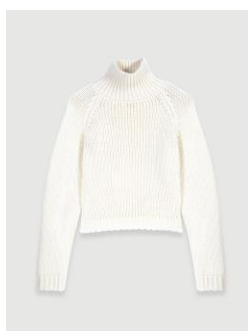
Sweater MOHO 255€ / 165€