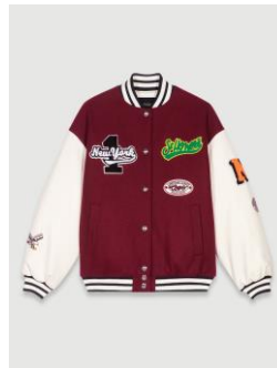
Jacket BELOVE 455€ / 295€