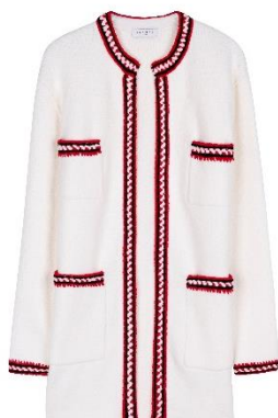
G30011E E19 LUCE Ecrû