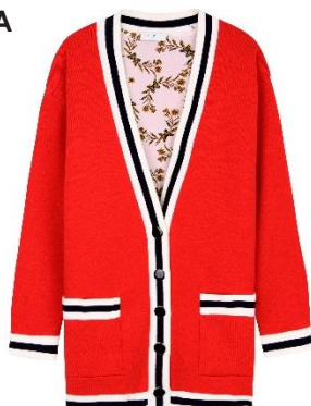
G30157E E19 JOHANNA Rouge Red