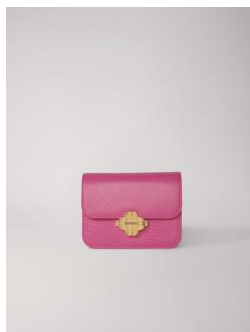
Sac CLOVERMINILIZARD 355€ / 230€