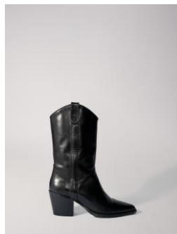
Chaussures FREEWEST 395€ / 256€