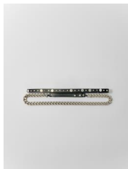
Ceinture AGRUNGECHAIN 145€ / 94€