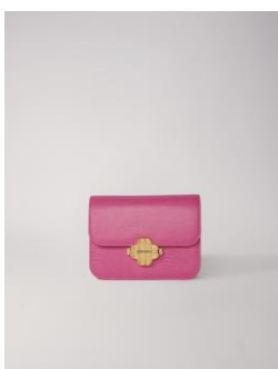
Sac CLOVERMINILIZARD 355€ / 230€