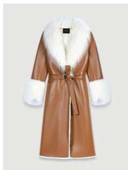
Manteau GAGA 495€ / 321€