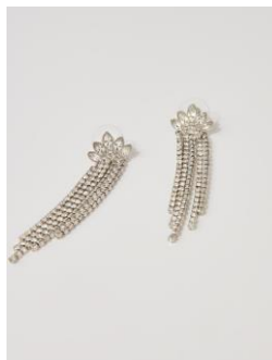
Boucles d'oreilles NFLECHECASCADE 95€ / 61€