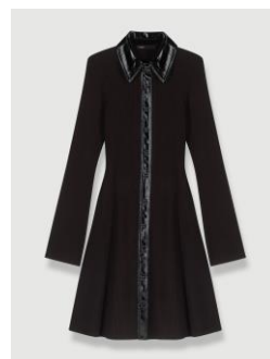
Robe ROSANIA 255€ / 165€