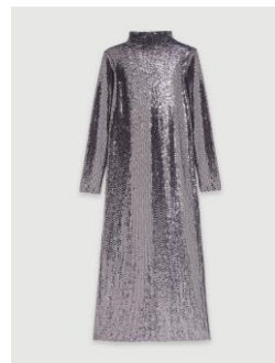
Robe RIPAJI 375€ / 243€