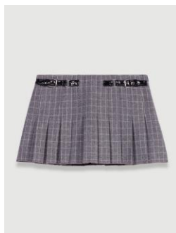
Jupe JOCELYN 215€ / 139€