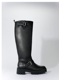
Chaussures FAZERY 435€ / 282€