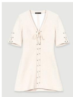
Robe RILENA 335€ / 217€