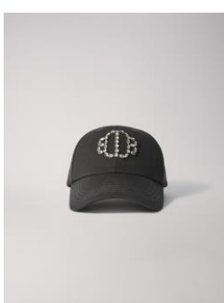
Casquette ECAPSTRASS 95€ / 61€