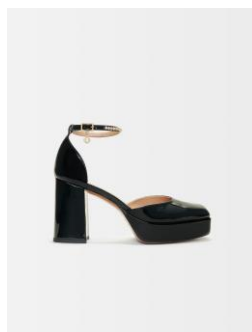
Chaussures FRANCI 335€ / 217€