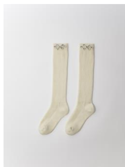
Chaussettes ESOCKFRONCE 45€ / 29€