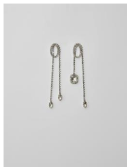
Boucles d'oreilles NHOOPCASCADE 95€ / 61€