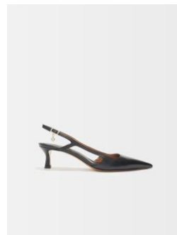
Chaussures FAYNA 295€ / 191€