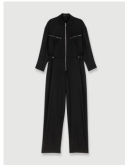
Combinaison PEPPA 335€ / 217€