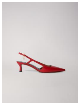
Chaussures FAYNAROUGE 295€ / 191€