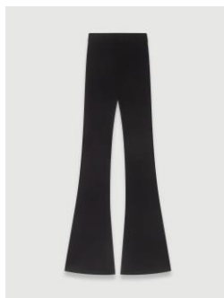
Pantalon PARISO 175€ / 113€