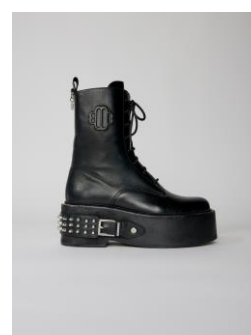
Chaussures FANGER 435€ / 282€