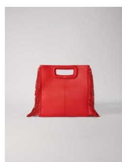
Sac MLEATHER 255€ / 165€