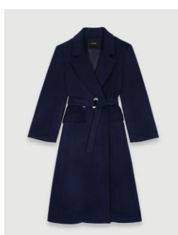
Manteau GIBLUE 535€ / 347€