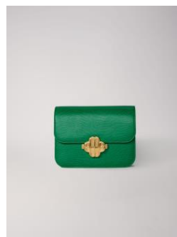
Sac CLOVERMINILIZARD 355€ / 230€