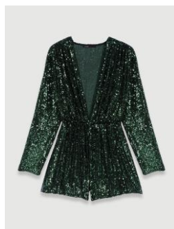
Combinaison ILETIS 295€ / 191€