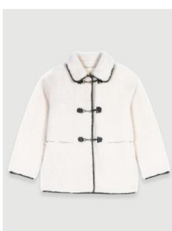
Manteau GALENCIA 1595€ / 1036€