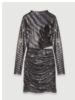
Robe RILEXISETTE 335€ / 217€