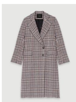
Manteau GAPINETTE 495€ / 321€