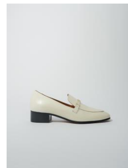
Shoes FILIKA 295€ / 191€