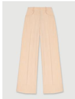
Pants PYRON 235€ / 152€