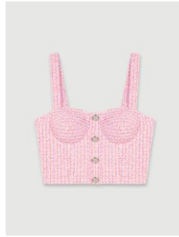
Top LARADIS 175€ / 113€