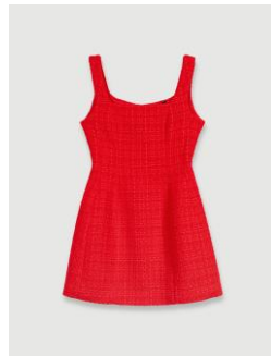
Dress RIBALA 255€ / 165€