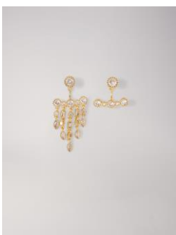
Earrings NPIERCINGPRECIEUX 55€ / 35€