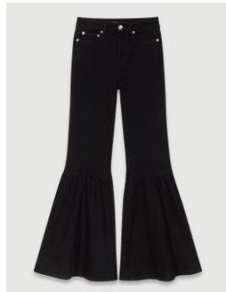
Jean PAFLENCONO 235€ / 152€