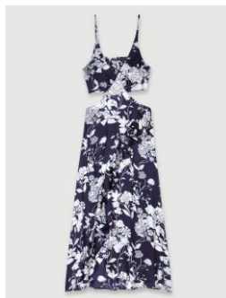
Dress RALLETIMI 235€ / 152€