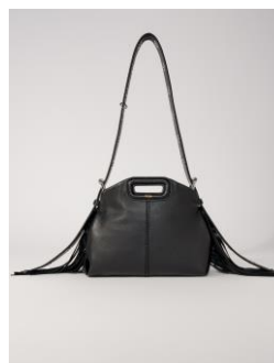
Bag MISSMMINICRINKLED 315€ / 204€