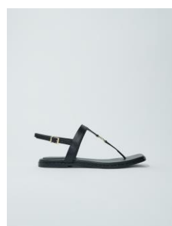
Shoes FENETTE 195€ / 126€