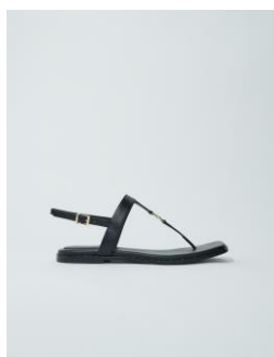
Shoes FENETTE 195€ / 126€