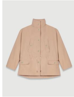
Jacket GICREAM 355€ / 230€