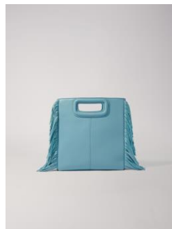
Bag MLEATHER 255€ / 165€