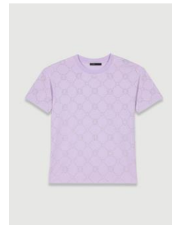
Tee shirt TSTRASS 135€ / 87€