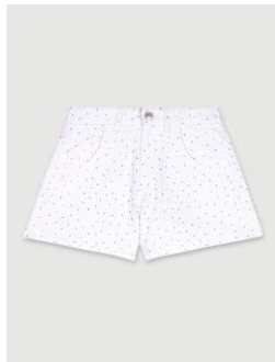
Shorts IDENIMPOKKAN 175€ / 113€