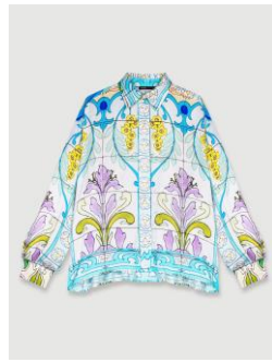
Shirt CEZAIQUE 255€ / 165€