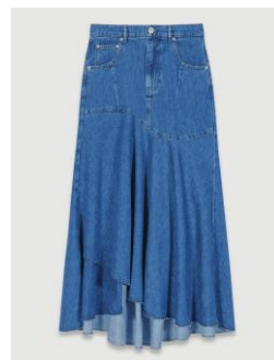
Skirt JONDULYS 235€ / 152€