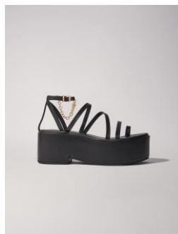
Shoes FONIWEDGE 275€ / 178€