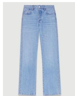
Jean PYCLOU 255€ / 165€