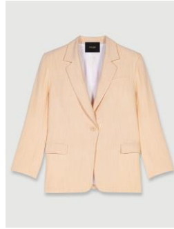
Jacket VYRON 355€ / 230€