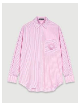
Shirt CHIAVITA 195€ / 126€