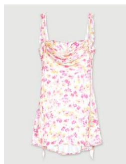
Dress ROMANTIK 275€ / 178€