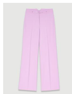
Pants PATRICIA 255€ / 165€