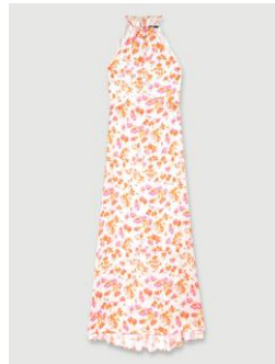
Dress RISPRING 295€ / 191€