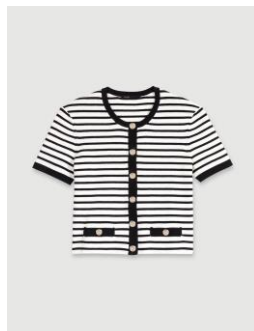
Cardigan MIROLLS 135€ / 87€