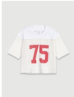
Tee shirt TEZGIN 115€ / 74€