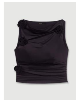
Top LOILA 195€ / 126€