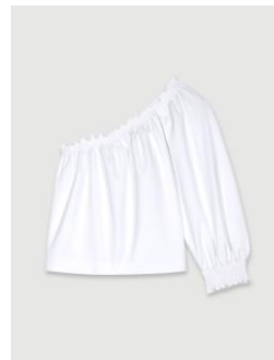
Top LOPINE 155€ / 100€