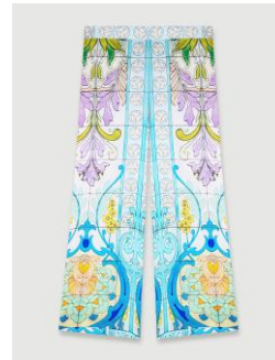
Pants PEZAIQUE 235€ / 152€