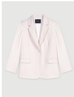
Jacket VIVALDI 395€ / 256€