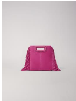
Bag MMINICHAINSUE 235€ / 152€