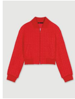
Jacket BALA 315€ / 204€