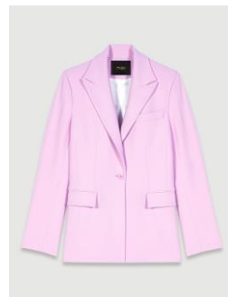
Jacket VATERICIA 355€ / 230€