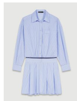
Dress RAUDRI 275€ / 178€