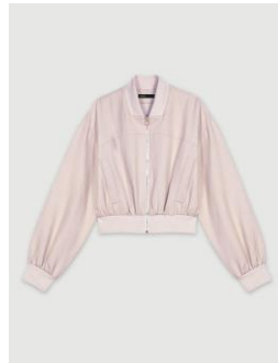
Jacket BALIMI 275€ / 178€