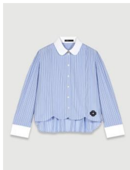
Shirt CAUDRI 115€ / 139€