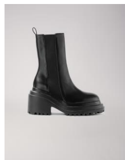
Shoes FUNKOU 375€ / 243€