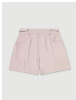
Short IALIMI 175€ / 113€