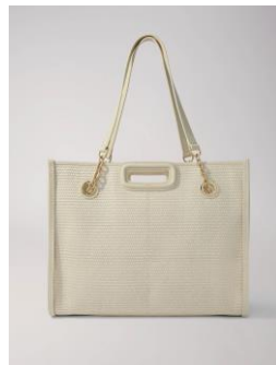
Bag MCABASRAFI 355€ / 230€