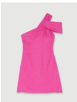
Dress REMA 235€ / 152€