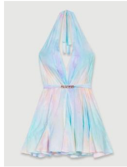
Dress RICIEL 275€ / 178€