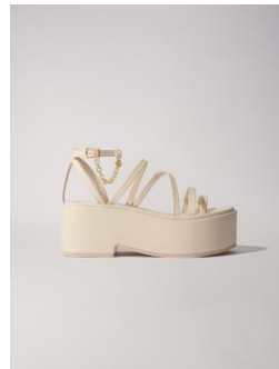
Shoes FONIWEDGE 275€ / 178€