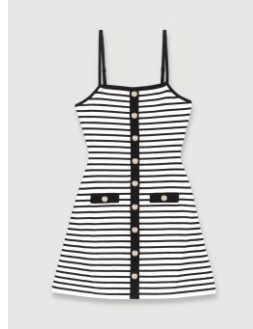
Dress ROLLS 195€ / 126€