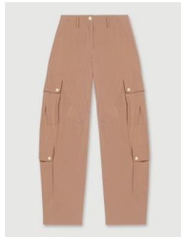
Pants PEKKAN 215€ / 139€