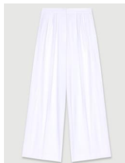
Pants POPINE 215€ / 139€