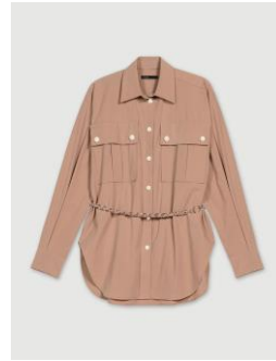
Shirt CIPEKKAN 275€ / 178€