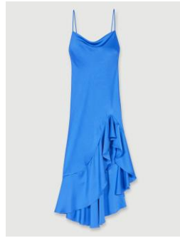
Dress RASMINO 275€ / 178€