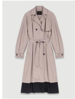
Coat GILUSAN 395€ / 256€