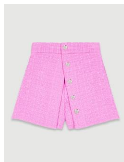
Short ILABAR 235€ / 152€