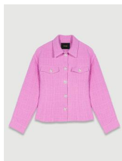
Jacket VALABAR 315€ / 204€